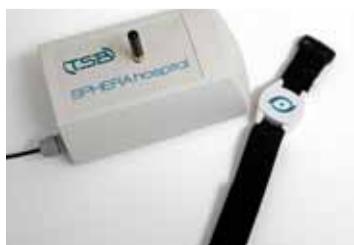
La pulsera y el equipo de aviso.

La inteligencia ambiental busca desde hace una década desarrollar entornos sensibles que respondan a la presencia y patrones de comportamiento humanos. En TSB Soluciones Tecnológicas han dado un paso más. La empresa valenciana apuesta por las viviendas inteligentes que ayudan al bienestar de sus habitantes con una novedad: el usuario no necesita dar ninguna orden