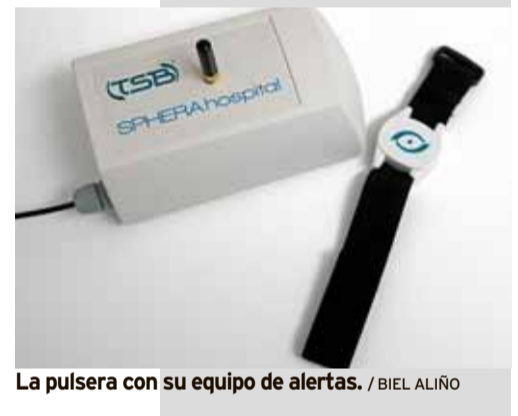
La pulsera con su equipo de alertas.

◆ Salupedia.org: Como complemento a sus servicios en el sector de la salud, TSB ha creado esta enciclopedia médica familiar en internet, donde el usuario puede encontrar información recomendada por profesionales de la Salud.