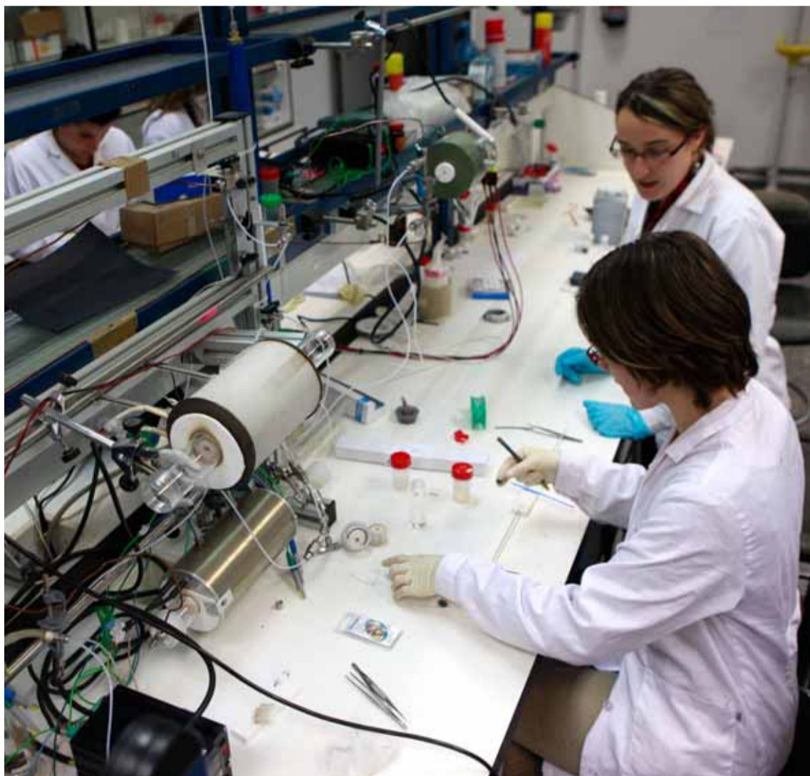
El laboratorio de energías renovables, pilas de combustible y membranas iónicas del ITQ que dirige Corma.

Para ello, obviamente, hacen falta hoy unos medios, un equipo, una organización y unas formas de comunicación muy complejas. Su concepción de cómo materializar toda esta filosofía investigadora en un centro de investigación pasa por una 'alquimia' que requiere de varios componentes: «Ideas originales (priorizar a la creatividad y la imaginación); profesionales bien formados, capaces de complementarse entre sí trabajando en equipo de forma muy colaborativa, para intentar conseguir en el proceso que la suma de