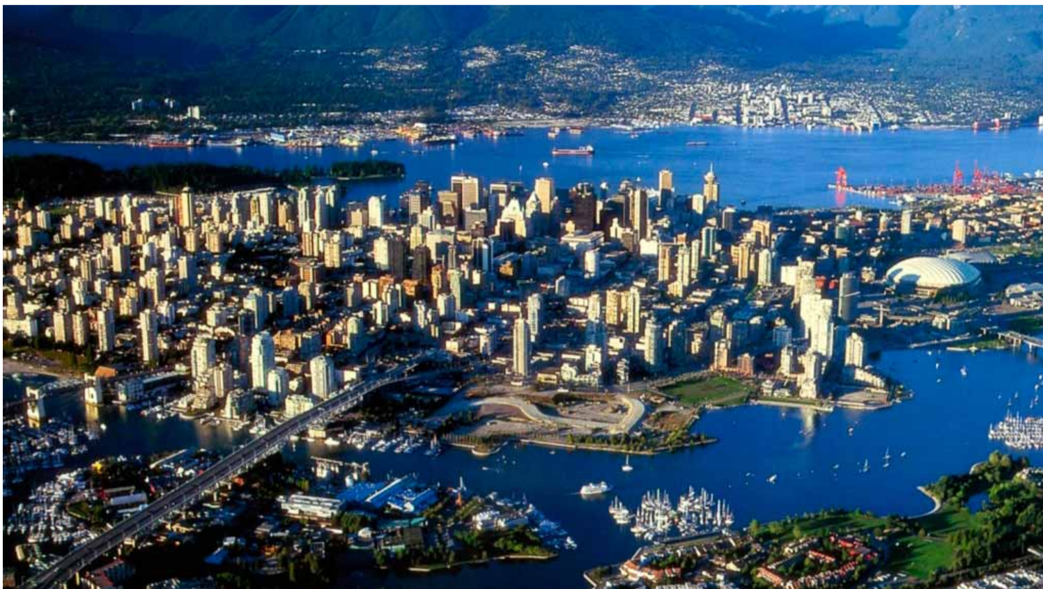
Vancouver, la ciudad más grande de Canadá, acoge estos días los Juegos Olímpicos de Invierno 2010.