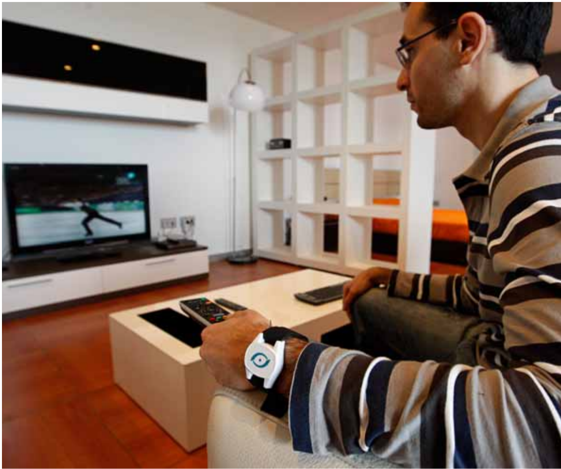
Uno de los ingenieros de la empresa TSB con la pulsera de alertas instalada en su muñeca izquierda.